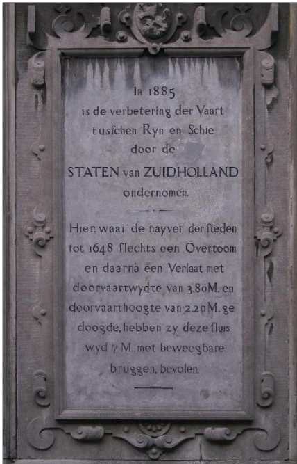
De tekst op de zijkant van het sluiswachtershuis in Leidschendam.