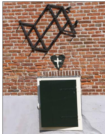
Afweerkruisje boven het luik van een melkkelder van een boerderij aan de Weipoort. Zo'n kruisje moest voorkomen dat de melk bedierf.