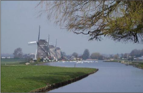
De molendriegang bij Leidschendam