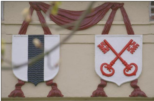
De wapens van Delft en Leiden op de Delftse Schouw