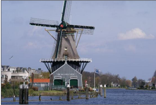
Houtzaagmolen “De Salamander” in Leidschendam