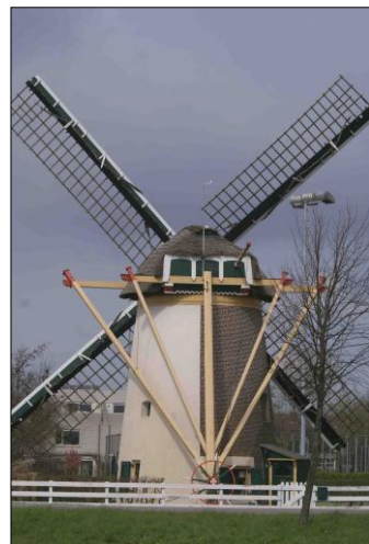
De Roomburger molen aan de overkant van het Rijn-Schiekanaal