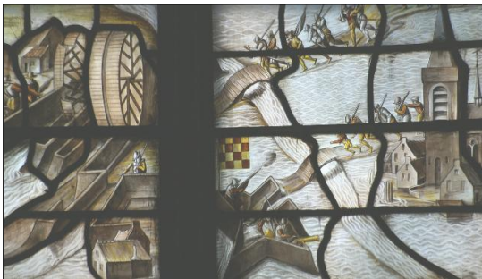
Detail van het Delftse glas in Gouda

Het grootste probleem voor een ontzettingsvloot via de Vliet was waarschijnlijk de dam bij Leidschendam. Die dam ligt op de grens van de Hoogheemraadschappen Delfland en Rijnland, de “Landscheiding”. Het Rijnland ligt daar wat hoger dan het Delfland. Nu is er een sluis, maar tot 1648 moesten boten met een “overtoom” over de dam gehesen worden. Op het zogenaamde “Delftse Glas” in de Janskerk in Gouda (met daarop het “Ontzet van Leiden”) is die overtoom met grote “windassen” te zien.