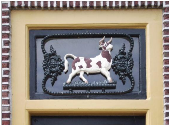
Bovenlichtdecoratie bij een van de boerderijen langs de Weipoortseweg