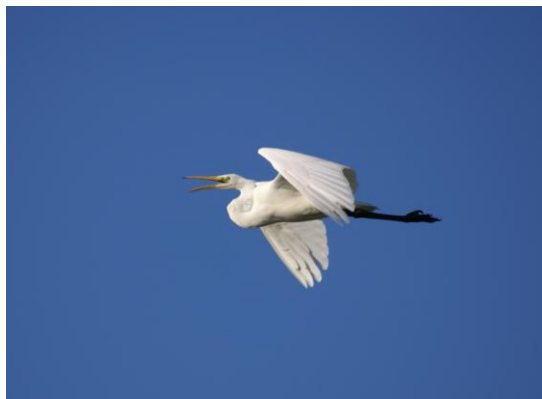
Grote Zilverreiger, van augustus tot april aanwezig in het poldergebied tussen Zoetermeer en Zoeterwoude.

Bij het uitzetten van de tocht is gestreefd naar een aantrekkelijke fietsroute. We passeren o.a. de molendriegang bij Leidschendam/Wilsveen, en rijden door het recreatiegebied Noord-Aa en de Weipoort. Met een beetje geluk zien we onderweg bijzondere vogels als Wulp en Grote Zilverreiger.