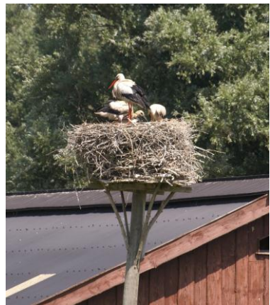
Ooievaars op het nest bij 't Geertje