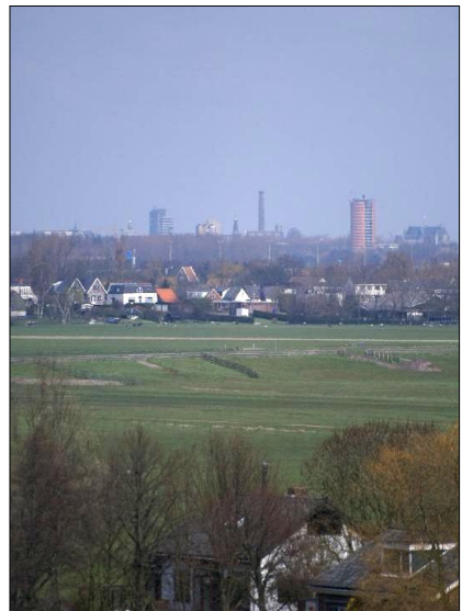
Uitzicht vanaf de uitkijkeuvel in het Buytenpark. Links Delft, rechts Leiden