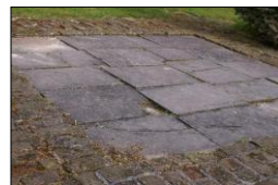
De Dorpskerk van Leiderdorp, met (boven) de plaats van de voormalige toren