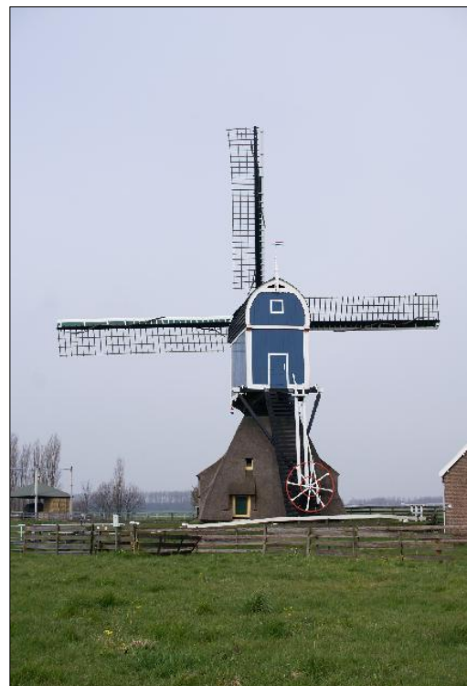
De “Groote Molen” in Zoeterwoude

Bij de Groote Molen het Molenpad naar Zoeterwoude Dorp nemen. Halverwege het pad even stoppen bij de picknickplaats.